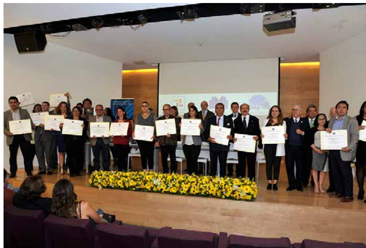
Ganadores del Premio al Arte Editorial.

En 1990 fundó Petra Ediciones, editorial que publica bellos libros de fotografía, arte, ficción y no ficción para niños y jóvenes creados por autores y artistas innovadores, que están convencidos que el valor de percibir, descubrir y comprender el mundo depende en gran medida de las experiencias significativas de la infancia.