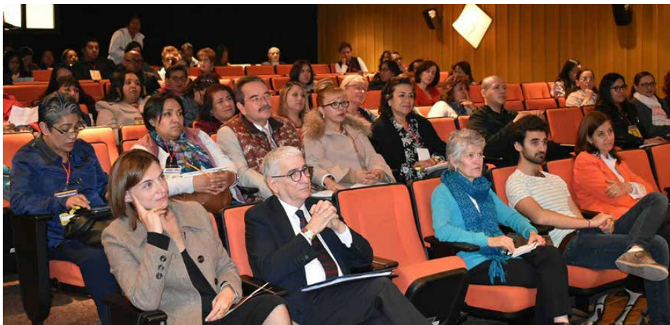
Parte del público asistente a los encuentros de bibliotecarios y libreros-editores.

La funcionaria de la Secretaría de Cultura consideró que aún se debe arraigar en los lectores la necesidad de adquirir libros, para consolidar a